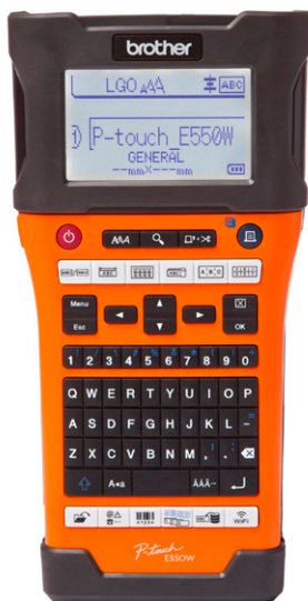
Ref. : SMT.PR.PTE.550 Imprimante portable 180 dpi

A utiliser avec stencil tape 24 mm SMT.ST.24.PT