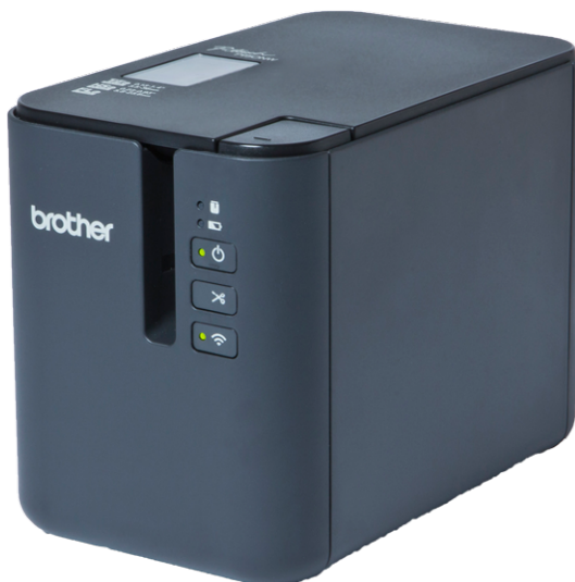
Ref. : SMT.PR.PTP.900.WYP1 Imprimante professionnelle 360 dpi. pour connexion PC

A utiliser avec : stencil tape 24 mm . SMT.ST.24.PT ou stencil tape 36 mm. SMT.ST.36.PT