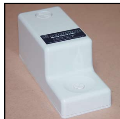
Réf. : SMT.NS.22.156 Distributeur doseur de neutralisant.