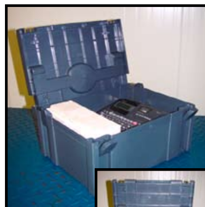
Réf. : SMT.SYS.03 coffre de rangement