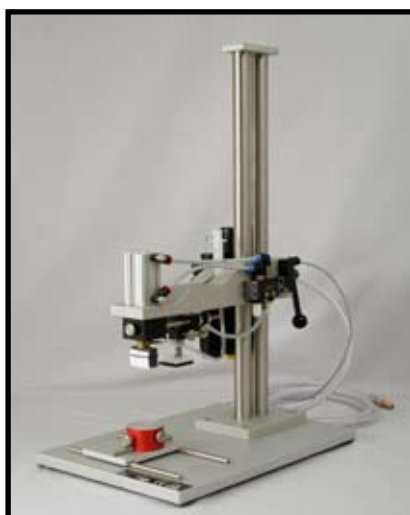
Réf. : SMT.56.075 Unité pneumatique sans pompe Automatise le mouvement de pression du tampon. Permet un positionnement optimal du pochoir et assure la répétabilité parfaite du marquage.