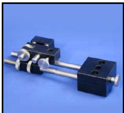
Réf. : SMT.56.500 réglage X, Y pour support de pochoir.