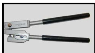
Réf. : TAT.21101 Poinçonneuse pour trous de Ø 5 mm dans le ruban inox Art.HUS.RE.020