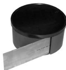
Réf. : HUS.RE.020 Ruban inox 301 (1.4310) pour la réalisation d' étiquettes. Largeur : 12,7 mm. Longueur : 5 m. épaisseur : 0,2 mm.