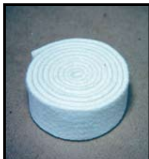
Réf. : SMT.F.22.145 1 m de feutre de rechange pour tampon.