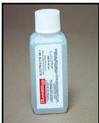
Réf. : SMT.E.22.001 Flacon de 100 ml d'électrolyte Il en existe plusieurs sortes en fonction de la matière à marquer. Généralement on utilise l'électrolyte AE 1.