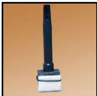
Réf. : SMT.S.29.802 Tampon de marquage manuel 15 x 30 mm (15 x 60 mm sur demande)