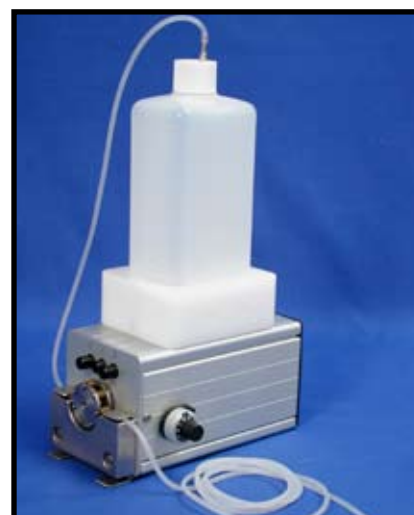
Réf. : SMT.35.005 Pompe pour électrolythe Assure un dosage parfait et répétable de l'électrolyte