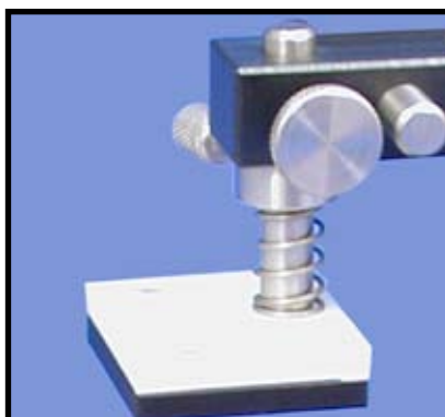
Réf. : SMT.56.700 Support pour pochoir longue durée de vie.