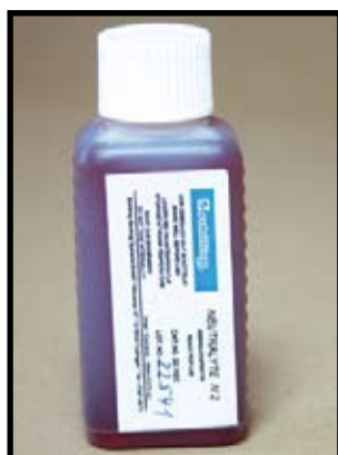
Réf. : SMT.N.22.102 Flacon de 100 ml de neutralisant N2.