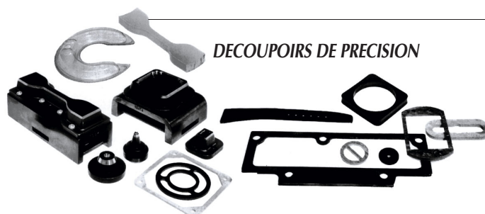
DECOUPOIRS DE PRECISION

Force de découpage : 3.500 daN, Dimensions table : 350 x 300 mm, Course : 6 - 20 mm, Portée : 200 mm.