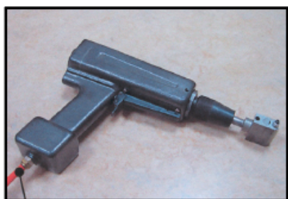
Persluchtvoeding (6 à 10 bar)