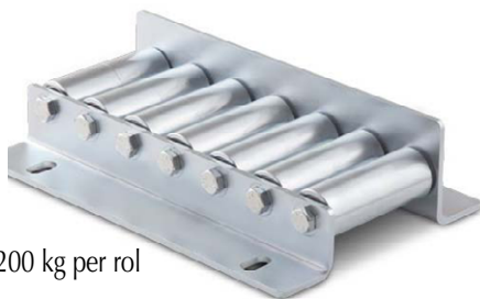
Afmetingen 200 kg per rol