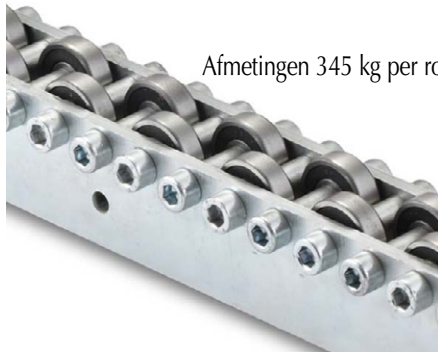
Afmetingen 345 kg per rol

Voor het transport en de opslagtechniek van zware containers of speciale paletten.